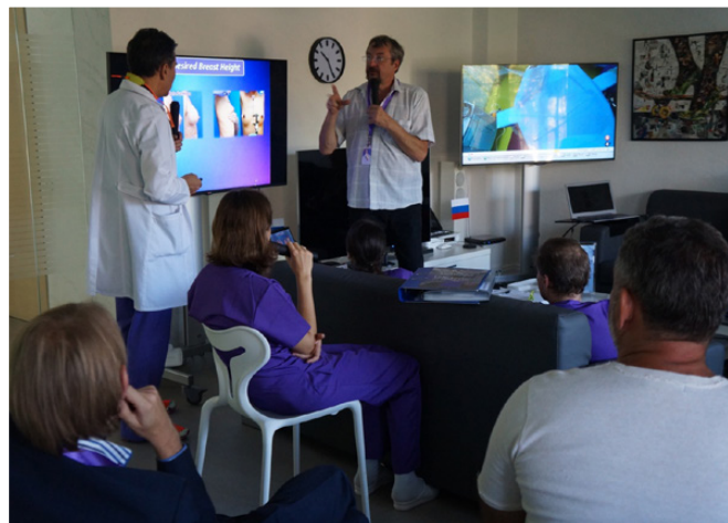
Рис. 23. Переводчику порой бывало непросто попеть за перепалкой