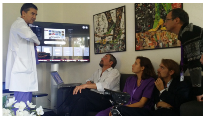
Рис. 19. Время разбрасывать камни

знаний и опытом, рассказывать достаточно откровенно о том «что хорошо, а что плохо». Видимо, было время собирать камни, теперь – время их разбрасывать (рис. 19).