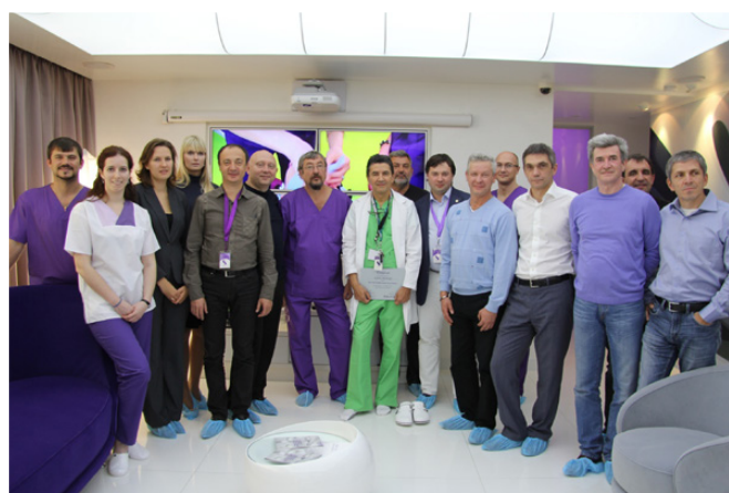
Рис.11. Общее фото на память

Атмосфера профессионального погружения и единения сохранялась до последних минут (рис. 11). И по признанию всех участников, это было здорово! Большое спасибо и, надеемся, до новых встреч, доктор Константин Стан!