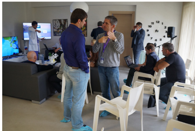
Рис. 14. Минимум четыре очага дискуссий в одном помещении одновременно, не считая телевизора

«почему так быстро заканчивается все самое интересное?» Отсутствие сухой лекторской риторики в выступлениях доктора Стана, живое обсуждение между нами, его гостями, всего того, что он преподнес нам в своем собственном видении, создавало атмосферу разговора «в кулуарах» между старыми друзьями (рис. 14). Видимо, должно прийти время создания новых способов взаимодействия и передачи информации в нашей профессиональной среде взамен уже поднадоевших многим «митингам». Точнее сказать, это время уже пришло – мы стали воодушевленными участниками, конечно же, далеко не первого подобного мероприятия в своем роде, но уж точно не последнего. Создалось ощущение «эмоциональной зарядки» от такого мероприятия, после которой не чувствуешь усталости, появляется жажда к освоению новых профессиональных веяний, их логическому осмыслению, анализу. Многочисленные митинги, напротив, зачастую оставляют после себя чувство усталости и «информационной каши» в голове, в которой еще нужно отделить зерна от плевел, систематизировать услышанное. Очень хотелось бы, чтобы данный формат развивался и приобретал новых сторонников среди наших коллег!