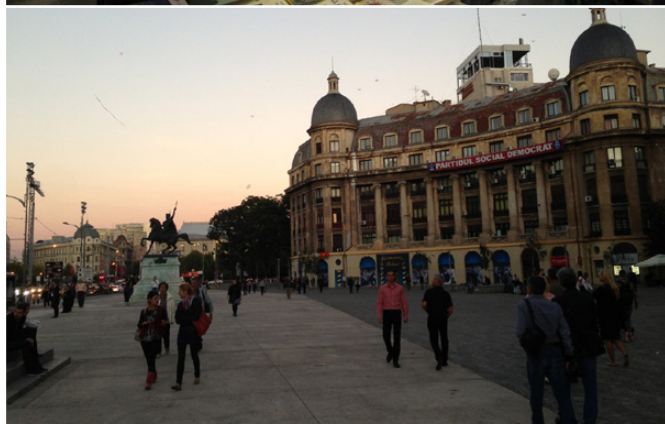
Рис. 2. Сегодняшняя трогательная скромная европейская страна. Кроме нас (внизу справа), других туристов не видно