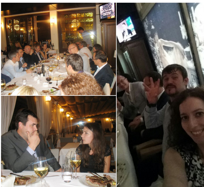
Рис. 16. Общий язык и симпатию не надо искать. Надо наливать