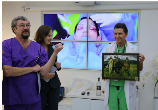
Рис. 18. Чуть кзади от картины Васнецова бутылка «Русский стандарт», еще дальше – трансляция завершения блефаропластики