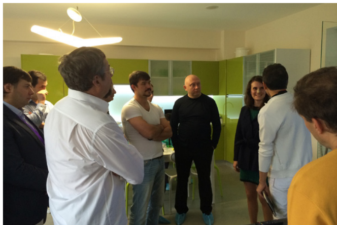
Рис. 22. Непривычно все. И время – девятый час вечера, и отсутствие следов ринопластики у пациентки на вторые сутки, и слова хирурга о том, что повторная ринопластика для него не промах, а скорее норма