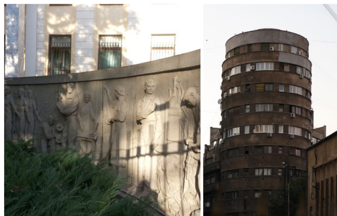
Рис. 4. Так было не всегда. Памятники тоталитарного прошлого

лии, а румынский язык похож на итальянский, у них около 80% общих слов.