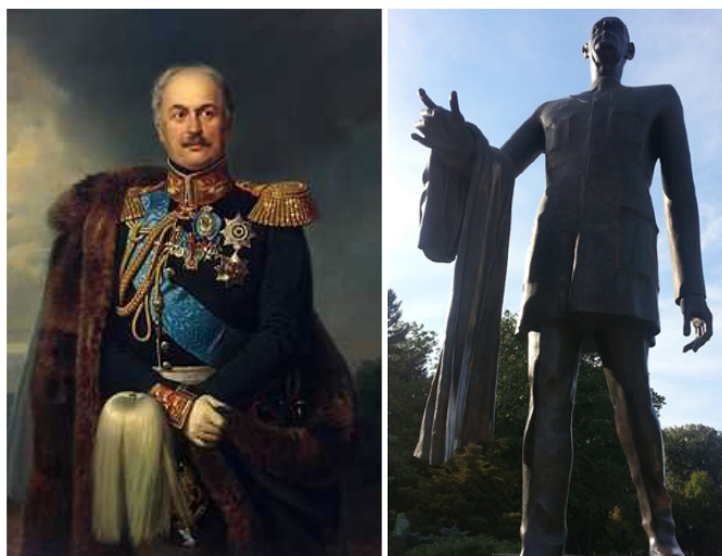
Рис. 3. Слева – граф Павел Дмитриевич Киселёв (1788–1872). После Русско-турецкой войны 1828–1829 годов управлял Дунайскими княжествами, находившимися под протекторатом России до 1834 года. Справа – Шарль де-Голль, каким-то особым образом симпатизировавший Румынии. Румыны приветливы, врагов не видят, должно быть, потому что не ищут

лии, а румынский язык похож на итальянский, у них около 80% общих слов.