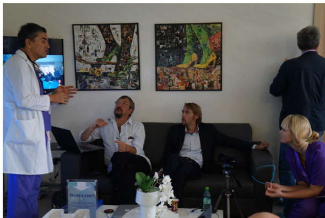
Рис. 21. «...когда выступает человек, одержимый своей профессией...»

Несмотря на ваше скептическое отношение к похвале, я не могу не сказать, что нахожусь под большим впечатлением. Это был мой первый опыт групповой поездки, и он оказался очень удачным. Я поняла, насколько важно ездить именно в клинику к доктору и иметь возможность задать ему любые вопросы. Думаю, что немалую роль сыграло то, что Вы были с нами и давали свои пояснения и иногда смешные, но чаще все-таки скептические комментарии (рис. 23). А то от восторгов точно голову бы унесло. Я, конечно, ожидала хорошего приема от доктора Стана, но впечатлил достаточно высокий уровень мероприятия, за что ему огромное спасибо (рис. 24). Наверняка найдется то, о чем можно с ним поспорить или задать еще множество вопросов, но в целом он дал нам «пищу для ума», а подумать точно есть о чем.