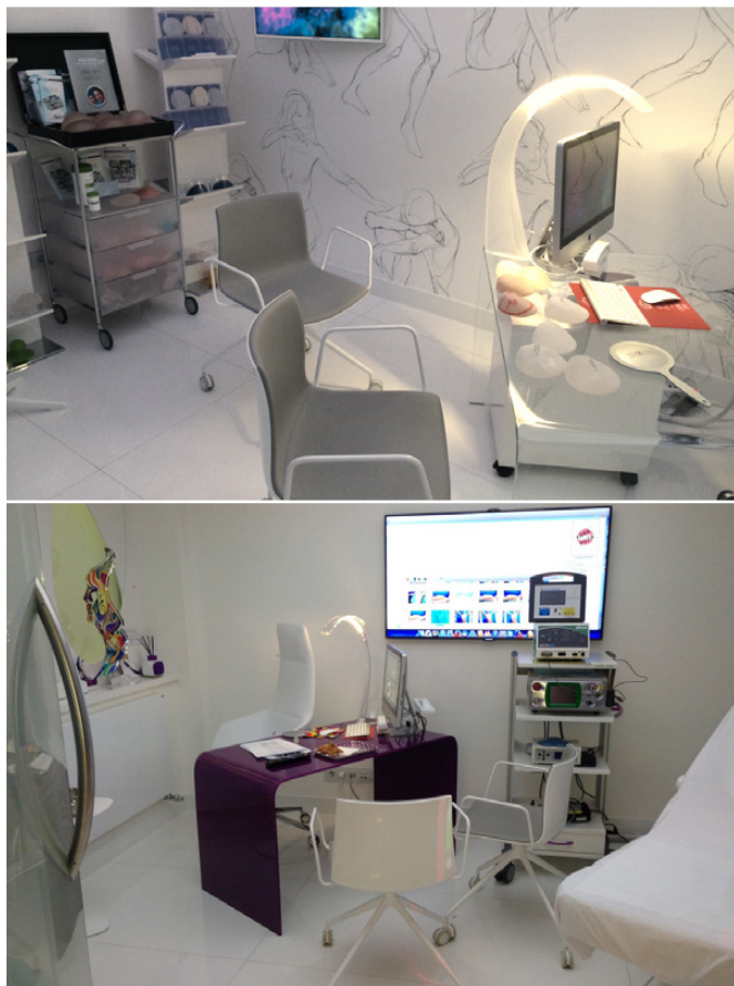
Рис. 6. Кабинеты приема: слева проводится аугментация молочной железы, справа – омоложение лица