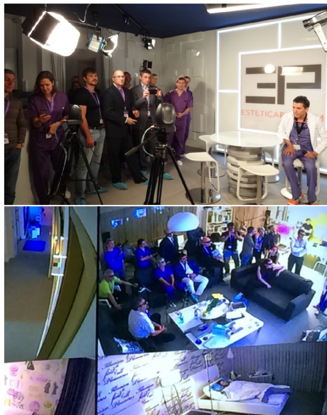
Рис. 8. Телестудия. Вверху слева – интерьер и оборудование пригодны для студийной продукции любого ранга. Пиар он и есть пиар. Супруга доктора Стана важная птица на национальном телевидении. Внизу справа – камеры натканы в каждом закулке клиники, их «картинки» сводятся в аппаратную, откуда выводятся на любой монитор. Здесь мы наблюдаем себя самих, судя по очкам смотрящих 3-D видео, ниже палата с пациенткой (пациенты подписывают согласие на непрерывное наблюдение первые часы после операции) и еще какие-то помещения или коридоры

когда кабинет пластического хирурга своими размерами и убранством призван производить шикарное впечатление. Операционная, помимо современного хирургического оснащения, оборудована видеокамерами, мониторами – всем, что необходимо для качественной видеотрансляции с системами обратной связи (рис. 7). Отдельная достопримечательность – телестудия. Да-да, в клинике есть комната, заходя